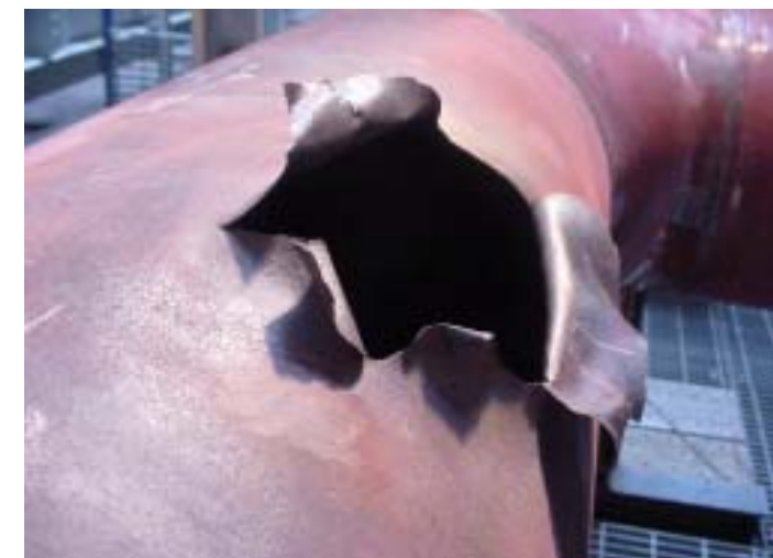
損傷部写真(上流より)