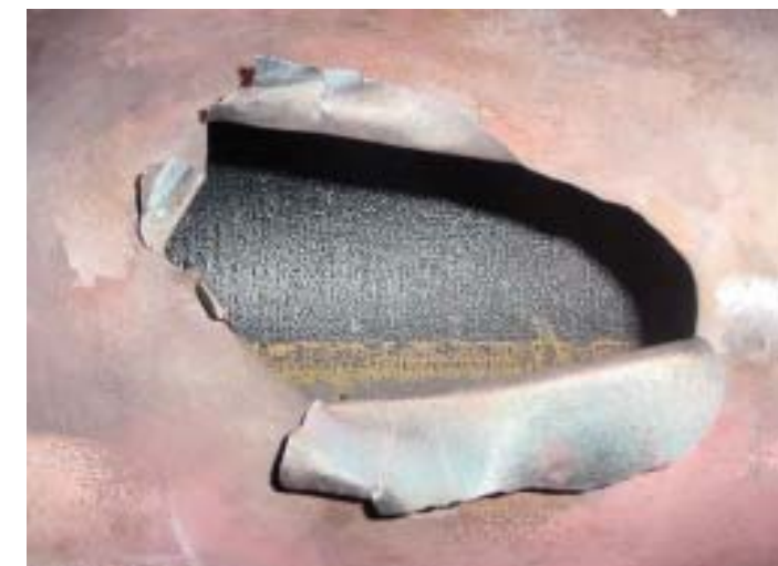
損傷部写真(正面より)