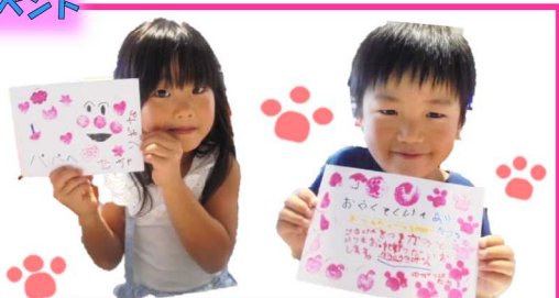
8月23日(日) ボトルキャップでスタンプをつくろう