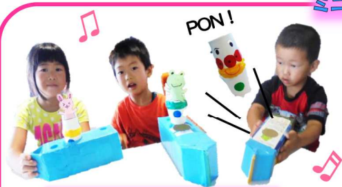
8月9日(日) 牛乳パック de 空気砲をつくろう！