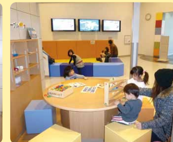
● 13 わいわいテーブル ●