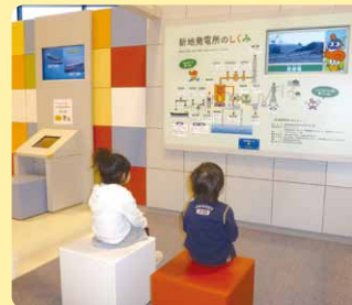
● 11 新地発電所のしくみ ●

展示室はエネルギーのテーマパーク。電気はどうやって生まれるのだろう? 環境のためにやっていることはどんなこと? いろんな"?"を遊びながら楽しく学ぶことができます。