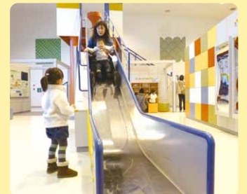
● 16 音のなるスロープ ●